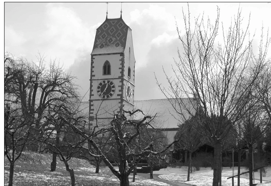
Die Neunkircher Bergkirche in winterlicher Kulisse