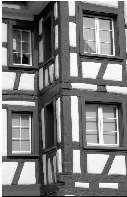
Fassadenausschnitt im Städtli

Das Jahr 2005 hat bereits begonnen und die restlichen Monate liegen vor uns.