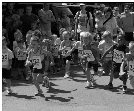
Massenstart der kleinen Sportler