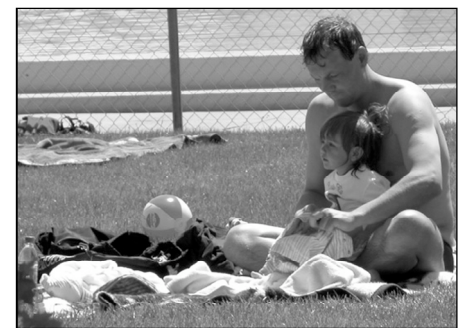
Badewetter im Wonnemonat Mai

Mit dem Verkauf von Bauembrot, Rickli, Hefezöpfen, Tabakrdlen, Weingueteli, weiterem Gebäck und Biedemeiersträssen am Verkaufsstand bei der Gemeindeverwaltung unterstützte der Landfrauenverein Neunkirch mit seinem Erlös die Vereinigung zur Begleitung Schwerkranker Schaffhausen und Umgebung.