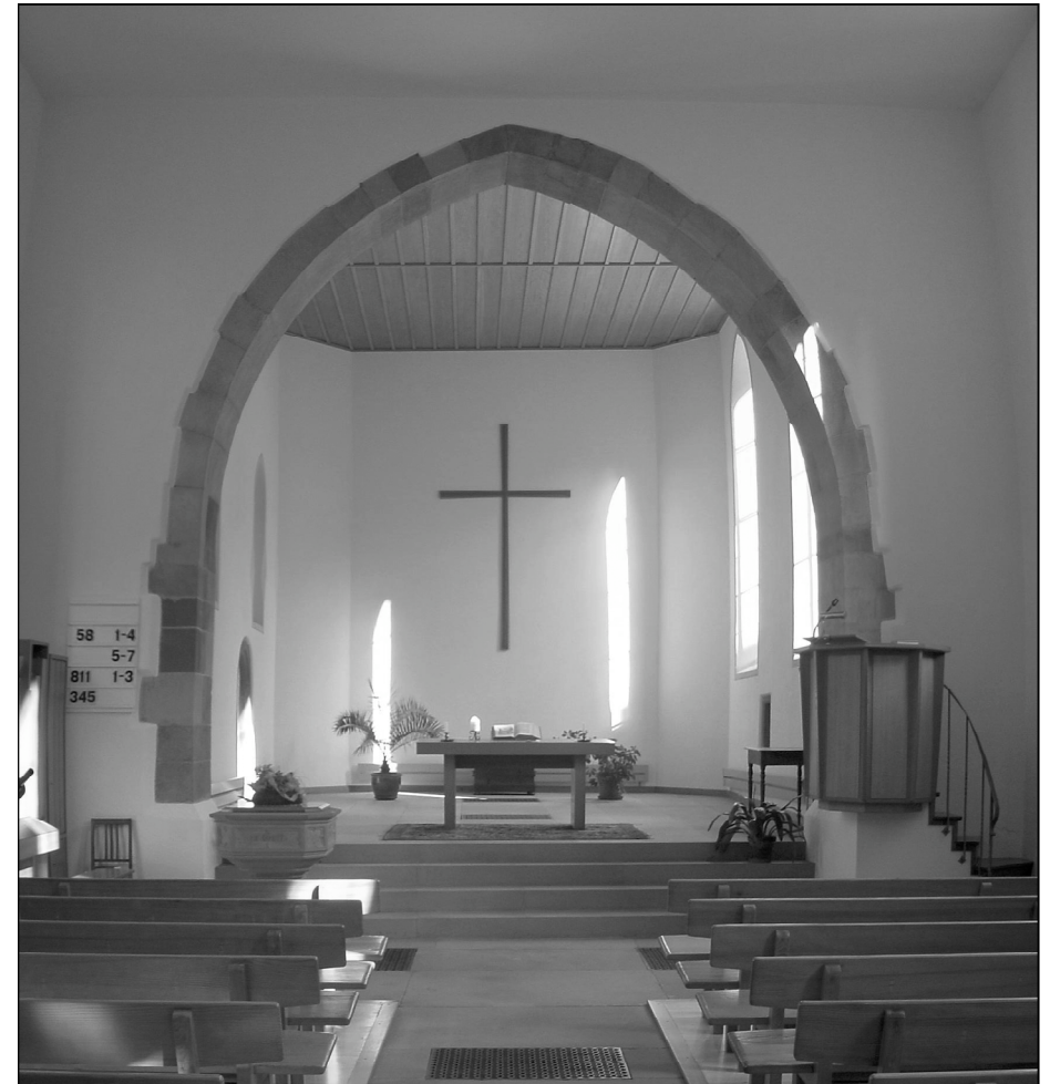
Die untere Kirche mitten im Städtli nach der gelungenen Renovation

1756 wurde die Sakristei abgerissen und ein Feuerspritzenmagazin angebaut. Die Feuerspritze ist durch die Kirchenpflege angeschafft worden. Gleichzeitig wurde auf der Aussenseite der Kirche eine Treppe errichtet, über die man die Ostempore vorne im Chor erreichen konnte. 1760 wurde das Innere der Kirche renoviert. Der Dachreiter in der Mitte der Kirche wurde entfernt und ein kleiner Glockenturm an der Stelle des heutigen Turms errichtet. Bei diesem Umbau wurden die Fenster auf ihre heutige Grösse vergrössert. 1866 erfolgte