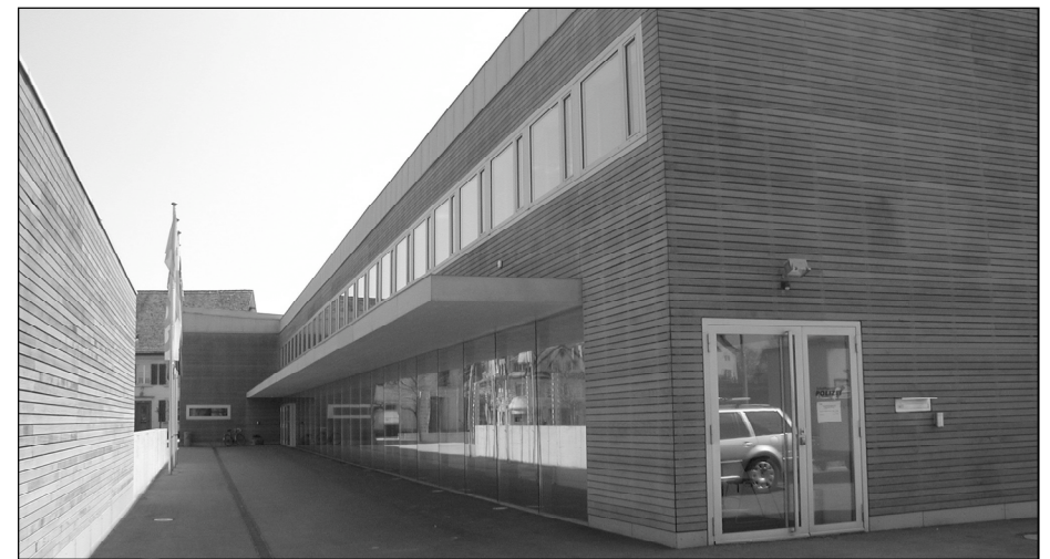
Die Gemeindeverwaltung ist in einem sehr modernen Gebäude untergebracht

Alles in allem sicher ein Traumberuf, der an Vielseitigkeit und an Interessantem nichts zu wünschen übrig lässt. Doch damit nicht alles nur auf einer Schulter lastet, ist es das diesjährige Ziel, Fabienne Rieser die notwendigen Kompetenzen zu vermitteln, damit die Verwaltungsangestellte ihre Chefin als Gemeindeschreiberin auch fachkundig vertreten kann.