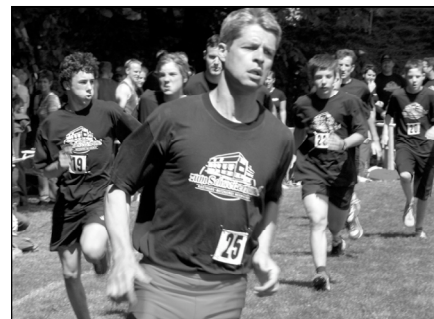
Der TVN im Einsatz in Beringen

Eine hervorragende Organisation, hohe Blasmusikkunst und Wetterglück: So lauteten die Attribute des Schaffhauser Kantonal-Musiktages, der dieses Jahr im Grenzdorf Trasadingen durchgeführt wurde. Nach der «Feten-Kult-Party» im Festzelt vom Samstagabend, waren es dann die rund 600 Musikantinnen und Musikanten, die zur Freude des zahlreich