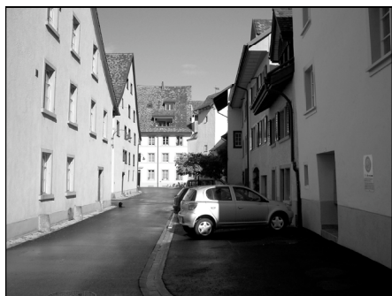
Blick in die Oberhofgasse

Der Frühsommer dieses Jahres entwickelte sich zu Beginn des Monats Juni recht zögerlich. Nachdem die Temperaturen vorerst unter der 20-Grad-Marke lagen, steigerten sie sich danach doch noch auf über 30 Grad Celsius. Dennoch war man gut beraten, sich zumindest mit einem Pullover oder einer Jacke zu «bewaffnen», denn morgens lagen die Werte oft im einstelligen Bereich. Am 22. und am 29. Juni wurde die Gegend zweimal frühmorgens von einem spürbaren Erdbeben erschüttert.