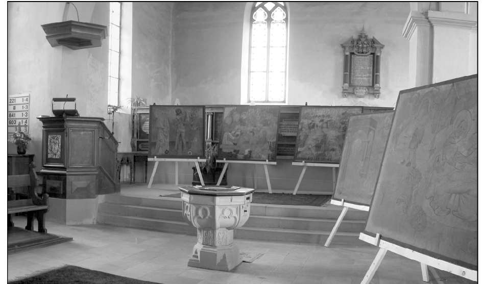
Bilderexhibition oder Freskenausstellung in der Kirche

Ihre Annegreth Steinegger Gemeindepräsidentin