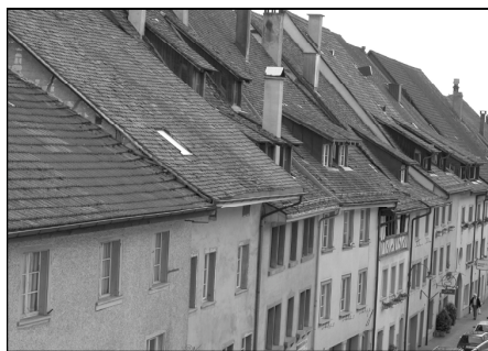
Nordfassaden der östlichen Vordergasse

Der April, eigentlich der Monat mit teils wilden Wetterwechseln, hielt für einmal nicht das, was er sonst verspricht. Mit Niederschlägen an lediglich zehn Tagen, keinem einzigen Frosttag und Temperaturen bis zu 24 Grad Celsius konnten die lokalen Wetterpropheten nur ein Fazit ziehen: zu trocken und zu mild. Durch die lauen Tage standen die Felder und Wiesen um Wochen verfrüht in voller Blütenpracht. Den unzähligen Spaziergängerinnen und Spaziergängern war jedoch anzusehen, dass sie die wärmere Jahreszeit, die im Eiltempo Einzug hielt, genossen.