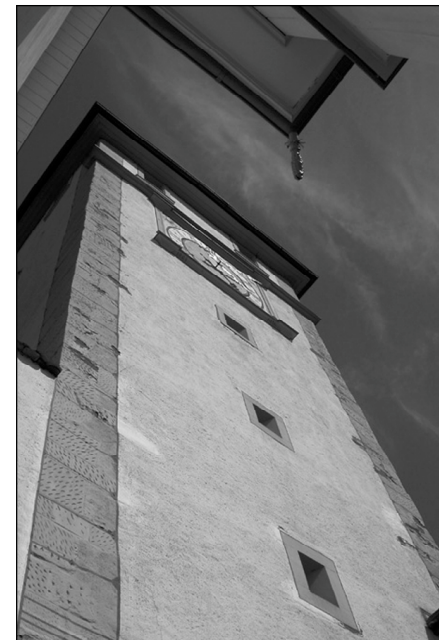
Das obere Tor aus der Mausperspektive

zeichnungen für Flur, Steg und Weg. Eine Bereinigung der Flurnamen mit unterschiedlichster Schreibweise drängte sich auf, da die Karten und Pläne des Kantons digitalisiert und auf die elektronische Bearbeitung umgestellt werden. Gleichzeitig werden alle Flurnamen auf die ätliche Aussprache überprüft und in Plänen die Gewannnamen nach Ortsgebrauch festgehalten. Als Gewährspersonen wurden Fritz Uehlinger , Markus Uehlinger , Gerhard Walter , Erwin Weibel und Hans Rähmi zugezogen. Nach der Bereinigung blieben noch über 800 Bezeichnungen übrig, die nun in einer Schreibweise, die der mündlichen Aussprache sehr nahe kommt und auf Flurnamenkarten festgeschrieben sind. Der «Gygenacker» schreibt sich jetzt «Giigenacker», anstatt «sWeltsche Gaarte» steht nun «Wälsche Gaarte» in den Plänen, und aus der Bezeichnung «Beim Bahnhüsle» wurde jetzt der «Bahnübergang Eerle». Für die eigentliche Schreibweise ist die kantonale Flurnamenkommission zuständig.