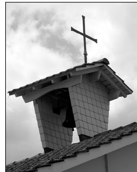
Die Glocke der katholischen Kirche