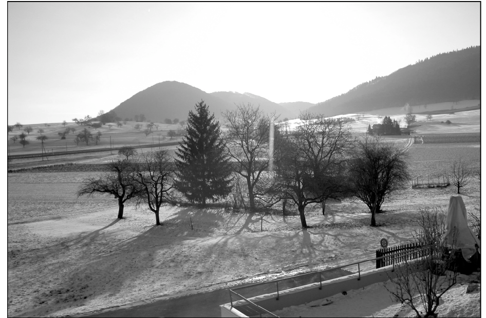
Das neue Jahr erwartet uns, wir sind schon mitten drin

Wolfgang Burkert, Gige buck 35, 8213 Neunkirch 052 681 26 22