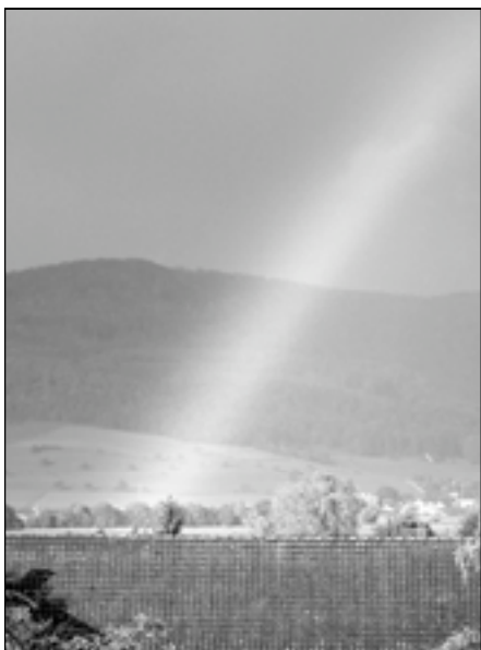
Regenbogen über der Gemeinde

Mehr als sommerlich startete der diesjährige erste Herbstmonat. Gleich an zehn Tagen (Mittel 2,9 Tage) stiegen die Temperaturen teils über 25 Grad Celsius und der Abschied des Sommers 2004 zeigte sich niederschlagsfrei. Mit der kühlestem Temperatur von 5,5 Grad Celsius und dem früheren Eindunkeln kündigte sich erstmals Mitte September der Herbst an.