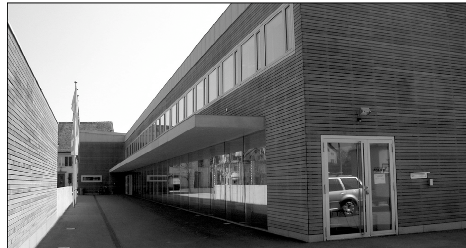
Der Eingang zur Polizeistation Neunkirch westlich der Gemeindeverwaltung

Am Samstag 2. Oktober wurde die Polizeistation Klettgau offiziell eingeweiht. Seit dem 1. Oktober werden alle Gemeinden des Klettgaus neu von der Station in Neunkirch betreut. Zur Verbesserung der polizeilichen Grundversorgung hat das Schaffhauser Polizeikommando die Station in der Gemeindeverwaltung aufgeweitet. Sechs Polizisten leisten Dienst.