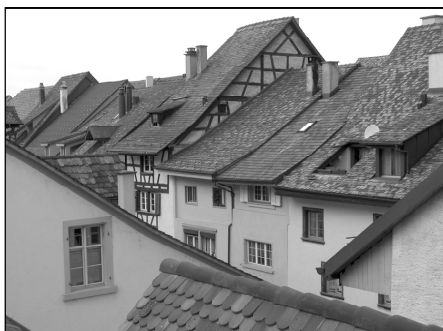
Dachlandschaft im Städtli

Mit Minustemperaturen startete der März recht kühl und teils begann es noch einmal zu schneien. Kurz vor dem kalendrischen Frühlingsbeginn stiegen dann die Temperaturen schon deutlich über 20 Grad Celsius. Witterungsmässig endete der dritte Monat des Jahres so, wie man sich ihn gerne um diese Jahreszeit vorstellt: Trocken und weiterhin mild.