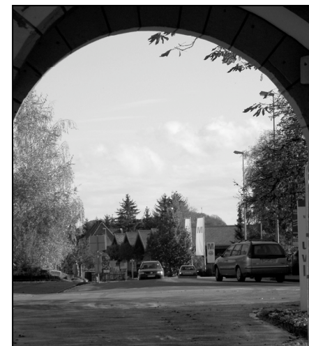
Blick durch den Torbogen

Gleich alle Neunkircher Babysitter wurden mobilisiert, als die inzwischen dritte Oldie-Disco über die Bühne ging. Statt eines fixen Eintrittsgeldes, konnte ein freiwilliger Beitrag zugunsten des Jugendraumes in die Kasse gelegt werden. Und