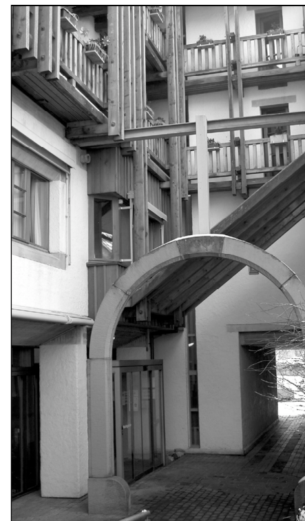
Durchgang beim Altersheim «Im Winkel»

Vor Ende der Sommerferien konnte die SP Neunkirch den Stimmberechtigten in der