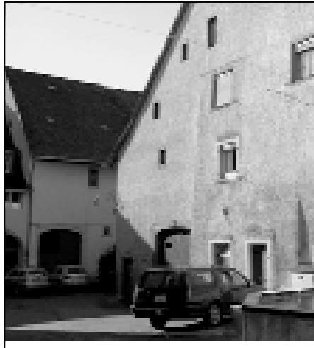
Blick von der Vorder- in die Hintergasse

Der goldene Oktober startete recht trocken und mild. Die Temperaturen stiegen teilweise noch über die 20-Grad-Marke. Doch mehr als die Hälfte des Monats war von zahlreichen Regenschauern geprägt. Mit einer Niederschlagsmenge von 137,4 mm wurde das monatliche Mittel von 60 mm mehr als das Doppelte übertroffen. Mit der kältesten Temperatur von drei Strichen über der Null-Grad-Marke wurde einem schnell bewusst, dass sich der Herbst schon deutlich früh in Richtung Winter neigt.