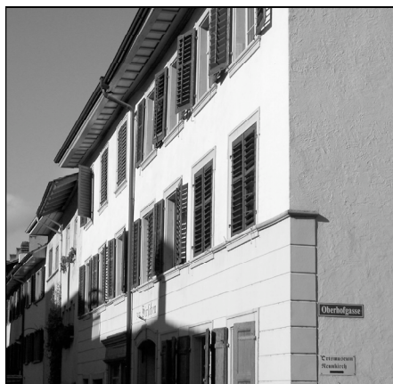
Ecke Vorgasse – Oberhofgasse

Der gut besuchte und traditionelle Adventsmarkt im Städtli deutete unmissverständlich an, dass die Weihnachtszeit vor der Türe stand. Gar nicht «adventsmässig» oder vorweihnachtlich präsentierte sich hingegen das Wetter. Regen, dann zehntägige Trockenheit und wieder Regen, prägten den Dezember. Schneefall vom 18. auf den 19. liessen Hoffnungen auf weisse Weihnachten aufkommen, doch am Christfest selbst, mussten die Wetterfrösche mit zehn Grad Celsius den wärmsten Dezembertag verzeichnen. Ebenfalls frei von Schnee präsentierte sich der Silvester.