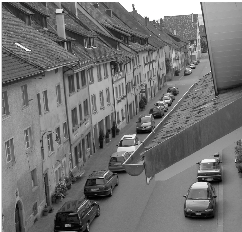
Die Vorgasse aus der Vogelperspektive

Wer sich in diesem Jahr nach einem weiteren «Jahrhundertssommer» mit hohen Temperaturen sehnte, der hoffte vergebens. Zahlreiche Nah- und Ferngewitter zogen über den Klettgau hinweg. Trotz 17 Regentagen und kühlen Temperaturen am Morgen gab es dennoch drei Hitze- und 17 Sommertage. Für die Daheimgebliebenen gab es im Ferienmonat nicht gerade viele Gelegenheiten, die Badeanstalt zu besuchen.