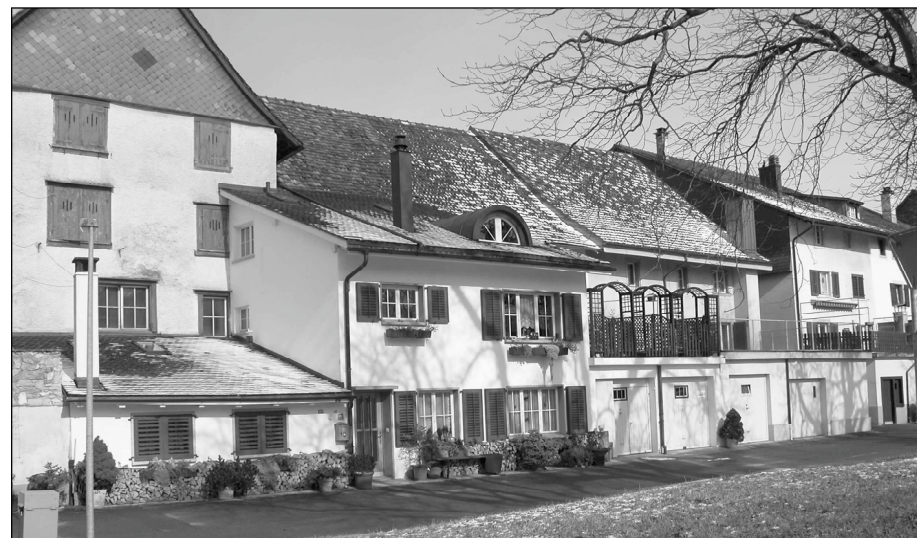
Fassadenfronten am westlichen Wettigraben

Der Einwohnerrat entstand 1936. In der Zeit der Parteigründungen wurden die Sektionen der Demokratischen und der Sozialdemokratischen Partei gegründet. Zudem wollte sich die Bevölkerung aktiver an der Gemeindepolitik beteiligen, um sich gegen das «Regime der Alt-eingesessenen» aufzulehnen. Der damalige «Einwohner- und Bürgerausschuss» befasste sich auftragsgemäss intensiv mit der Gemeindepolitik. Ende der Achtziger wollten kritische Stimmen den Rat abschaffen. Ein Jahrzehnt später befassten sich gleich zwei Kommissionen mit dem «absehbaren Ende» der Legislative. Die Gemeindeversammlung beschloss jedoch Ende 1999 mit grossem Mehr die Beibehaltung dieser Behörde. Zuvor und bedingt durch das neue Gemeindegesetz wurde der Rat auf zwölf Mitglieder aufgestockt. Die Legislativmitglieder sollen die Wünsche, Anregungen und Interessen der Bevölkerung wahrnehmen und realisieren.