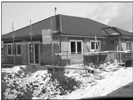
In Neunkirch wird wieder gebaut

Die Zeit für eine Steuerfussreduktion war reif. Mit dem neuen attraktiven Ansatz ist die Gemeinde Neunkirch für Bewohner und Neuzuzüger sowie für das Gewerbe eine gute Adresse. Bauland ist genügend vorhanden.