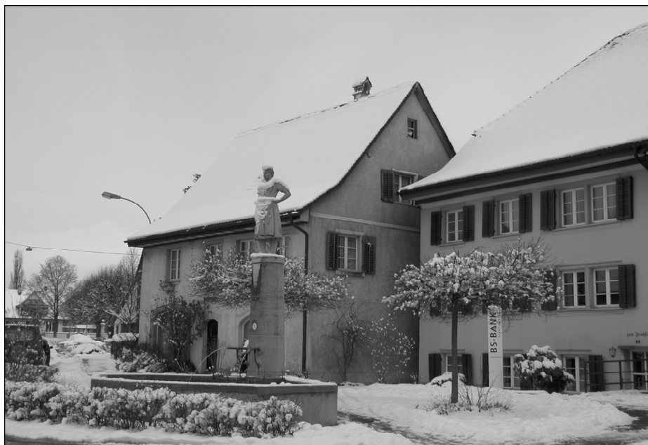
Der Klettgauerplatz in ein winterliches Weiss gehüllt

Das neue Jahr wurde mit schönstem und sonnigem Wetter begrüsst. Ein würdiger Jahresbeginn, so wie man ihn sich gerne vorstellt. An insgesamt sechs Sonntagen – von Mitte Januar bis März – luden die Mitglieder des Schützenvereins zum Besuch in die Besenbeiz ein. Nach einem Sonntagsausflug genossen jeweils Gross und Klein die gemütliche Zeit «im Hom». Ein Extra-Kinderspieltisch mit Überraschung für die Kleinen sowie die «Hundebar» und «Pferdebar» für die Vierbeiner waren eingerichtet, so dass der Aufenthalt am Waldrand jeweils zu einem gemütlichen Erlebnis für die ganze Familie wurde. Ein sympathisches Angebot, das Gluschtiges und Auserlesenes aus der Küche sowie zahlreiche Getränkevariationen sorgten für das