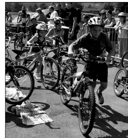
Fliegender Wechsel aufs Velo

Die Entscheidungen wurden vom zahlreich erschienen Publikum zum Teil freudig gefeiert. Für den Applaus gab es genug Gelegenheiten, wurden doch insgesamt zehn verschiedene Kategorien gewertet. Die Strecke für die 7- bis 9- und 10- bis 12-Jährigen Läufer wurden gegenüber 2003 leicht verkürzt. Nach einhelliger Meinung waren die neu zu absolvierenden 710 m auch für weniger professionell vor-