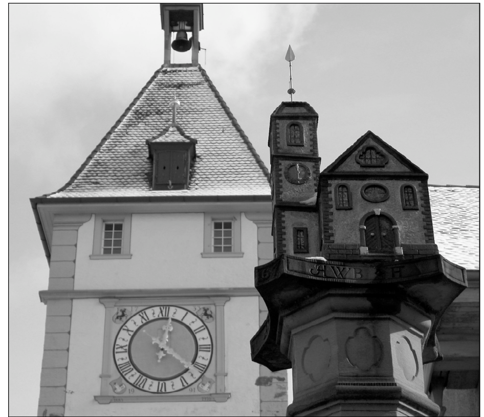
Zwei Neunkircher Symbole auf einem Bild vereint