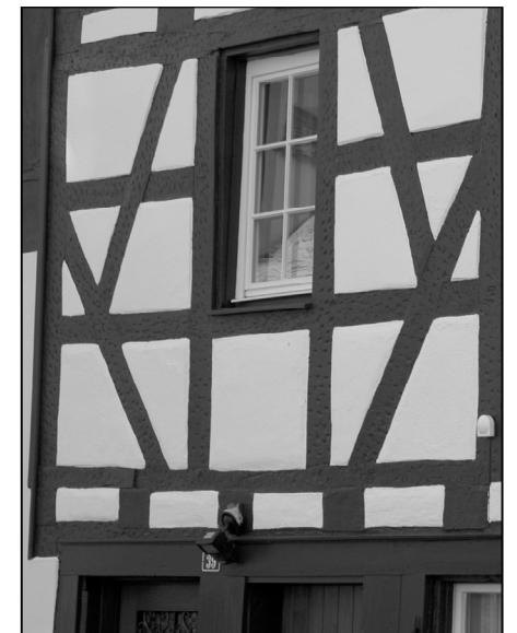
Fassadenausschnitt an der Hintergasse