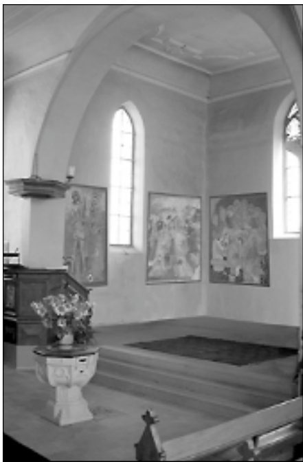
Zeitzeugen aus Jahrhunderten

Das Rad der Geschichte drehte sich weiter und einige Jahrhunderte später, wir schreiben jetzt 1878, wurde die Bergkirche erneut renoviert. Bei dieser Renovation erhielt die Kirche ihr gesamtes und heutiges äusseres Aussehen. Der Historische Verein Schaffhausen liess die oberste Schicht der Fresken freilegen und durch J.R. Rahn Kopien in Originalgrösse anfertigen. Sie zeigten das damals aktuelle Aussehen der Fresken. Auf Umwegen kamen diese Kopien in den Besitz des Museums zu Allerheiligen und wurden weitgehend vergessen. Jetzt machen wir einen Sprung fast in die Gegenwart. Vor über einem Jahr begann ich, mich intensiver mit der Geschichte der Bergkirche zu beschäftigen.