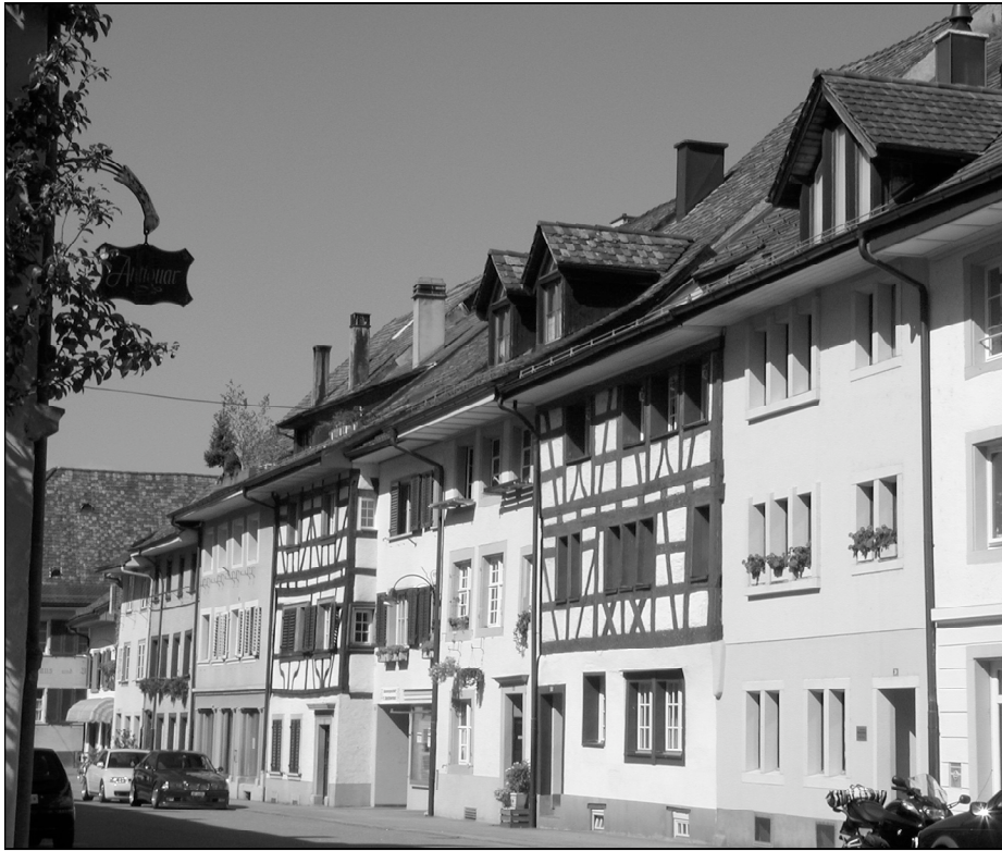
Südfassaden der westlichen Vordergasse

Der Start des letzten Sommermonates war viel versprechend, konnten doch gleich zu Beginn zwei so genannte Hitzetage mit deutlich über 30 Grad Celsius notiert werden. Am 6. August fiel während eines Gewitters mehr als die Hälfte des durchschnittlichen Niederschlages. Die Gesamtregenmenge lag deutlich über dem normalen Mittel. Die ersten Morgentemperaturen unter der Zehn-Grad-Marke verkündeten überraschend früh, dass der Herbst wohl nicht mehr lange auf sich warten liess.