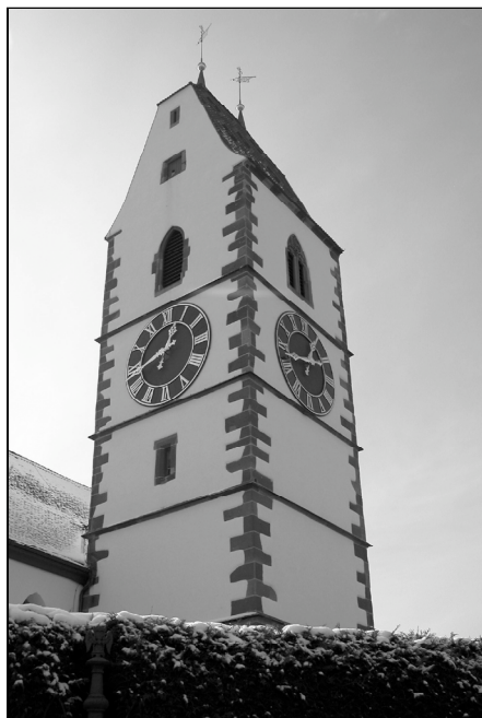
Die Bergkirche – Neunkirchs Wahrzeichen

Mit Konzerten in der Kirche, Adventsfenstermim und um das Städtli, viel Weihnachtlichem, Nachdenklichem, Warmem und Schönem neigte sich erneut ein Jahr dem Ende zu.