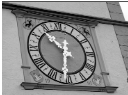
Turmuhre des Oberen Tores

Nach lang anhaltenden wärmeren Tagen schmolz der Schnee sichtbar dahin und die winterliche Pracht verliess das Chläggital. Die kräftiger werdenden Sonnenstrahlen taten nicht nur der Seele gut und lockten viel Spaziergängerinnen und Spaziergänger in die freie Natur, sondern weckten auch erste Frühlingsempfindungen. Da und dort sah man bereits die ersten Personen, die sich bei lauen Temperaturen das erste Mal draussen liegend und sitzend aufwärmen. Doch die Sonnenhungrigen hatten sich zu früh gefreut. Mitte Monat zogen kühlere Temperaturen übers Land und am Morgen des 23. Februar überraschte erneuter Schneefall. Das Weiss gab Anlass zum Räumen der Strassen und Wege. Der Winter hatte sich noch nicht verabschiedet.