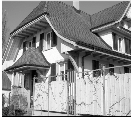
Haus am Seltenbachweg

Überdurchschnittlich trocken präsentierte sich der elfte Monat des Jahres. Mehr als die Hälfte der Tage waren niederschlagsfrei. Mit knapp 14 Grad Celsius wurde die höchste Temperatur gemessen. Gegenüber dieser Marke lag der tiefste Wert gleich 21 Grad darunter, also im Minusbereich. Im Vergleich zum langjährigen Mittel von 8,8 Frosttagen, lagen diese mit einer Anzahl von 13 deutlich darüber.