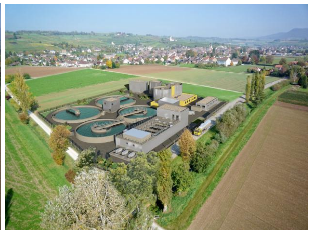
Visualisierung der geplanten Abwasserreinigungsanlage

Der erste Lösungsansatz, ein Zusammenschluss mit den grenznahen ARA's in Deutschland zu einer "Gross-ARA", wurde Anfang 2009 auf politischer Ebene verworfen. Der Abwasserverband verfolgte anschliessend die Erneuerung der eigenen ARA mit einer möglichen Erweiterung des Dienstleistungsangebotes zu "Infra-Werken" Klettgau. Dafür wurde die Strategie mit einem Projekt-Wettbewerb auf der Basis einer funktionalen TU-Ausschreibung gewählt. Die Delegiertenversammlung des Abwasserverbandes genehmigte im Herbst 2009, resp. Frühjahr 2010, entsprechende Planungskredite in der Höhe von insgesamt CHF 650'000. Die Auswahl des Totalunternehmers (TU) erfolgte in einem zweistufigen, selektiven Verfahren gemäss Submissionsgesetzgebung. Für die eigentliche Wettbewerbsphase wurden vier Totalunternehmer zugelassen, welche, zwischen Mai und Oktober 2010, anhand eines umfangreichen Pflichtenheftes ihre Offerten ausarbeiteten.