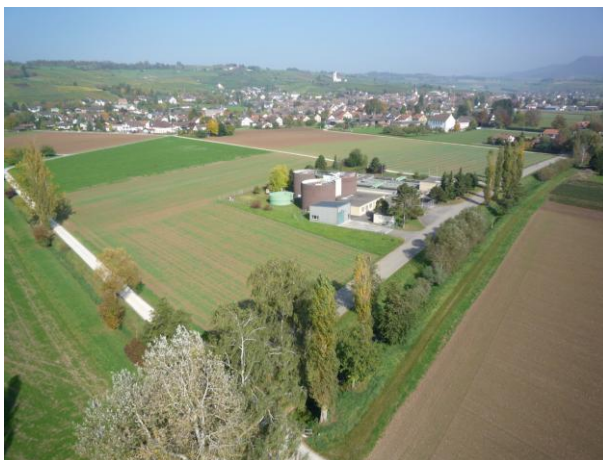
Heutige Abwasserreinigungsanlage in Hallau

Die Abwasserreinigungsanlage (ARA) Hallau steht seit 1976 und somit seit 35 Jahren im Dauereinsatz. Die Anlage ist sanierungsbedürftig und muss umfassend erneuert, ausgebaut und an die neuen Vorschriften angepasst werden. Ergänzend zu ersten Sanierungs- und Ausbaustudien vom Frühjahr 2005 wurden im Jahr 2007, im Rahmen einer Studie der EAWAG (Eidgenössische Anstalt für Wasserversorgung, Abwasserreinigung und Gewässerschutz), verschiedene Zukunfts-Szenarien für die Entwicklung des Einzugsgebietes und deren Auswirkungen auf die Anforderungen an die ARA diskutiert.